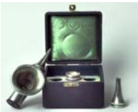
Otoskop nach Brunton 1862