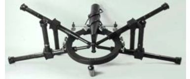
Polylaryngoskop nach Brünings: „Neunauge“