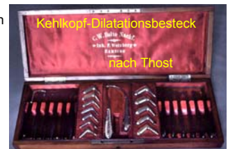
Kehlkopf-Dilatationsbesteck nach Thost