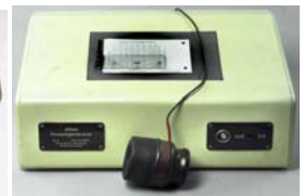
Atlas Rauschgenerator 1947