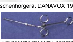
Polypenschnürer nach Hartmann