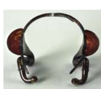
„KaWe Ohrbrille“ 1900