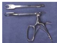
Tonsillotom nach Sluder-Ballenger