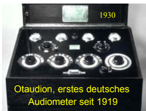
Otaudion, erstes deutsches Audiometer seit 1919