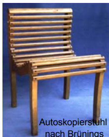
Autoskopierstuhl nach Brünings