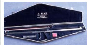
Monochord nach Struycken-Schaefer 1910