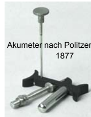
Akumeter nach Politzer 1877