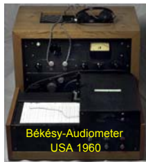
Békésy-Audiometer USA 1960