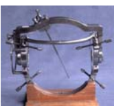
Hypophysenzelgerät nach Mündnich 1959