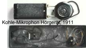
Kohle-Mikrophon Hörgerät, 1911