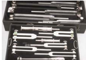
Tonreihe nach Bezold-Edelmann 1894