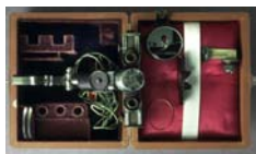
Binokulare Prismenbrille v. Eicken/Nickol 1921