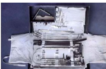
Instrumentarium zur Broncho-Ösophagoskopie nach Brünings